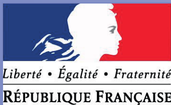
Plate-forme de l'observation sanitaire et sociale d'Auvergne